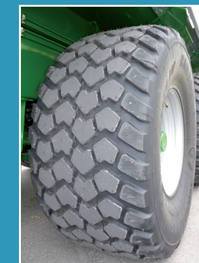
560/60R22.5 X BIB CARGO MICHELIN