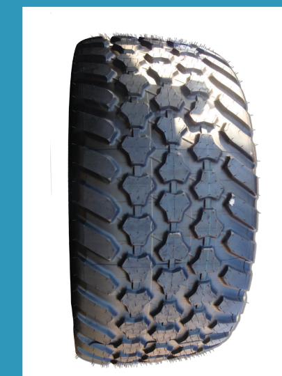
560/60R22.5 X BIB CARGO HD MICHELIN