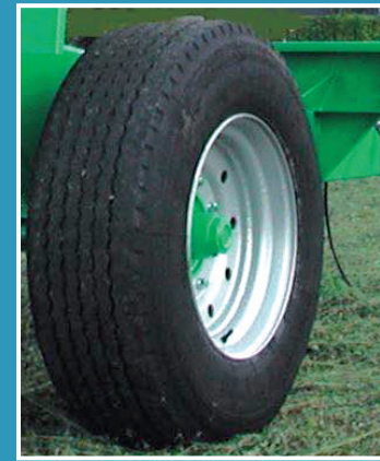
15R22.5 us. (385/65R22.5)