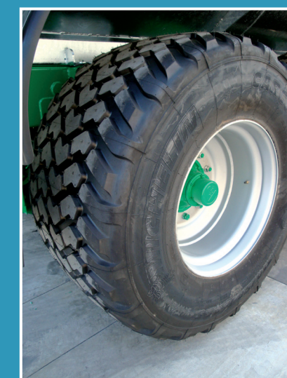
710/50R26.5 X BIB CARGO MICHELIN