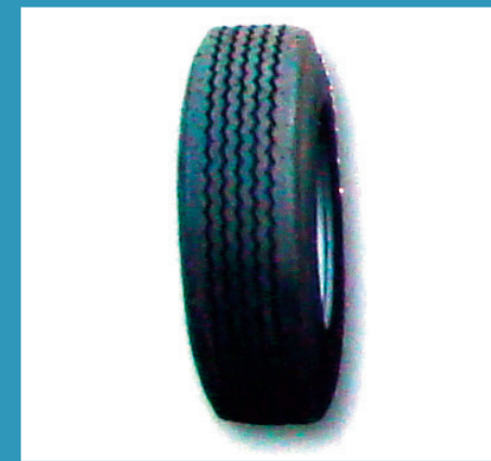
16R22.5 us. (425/65R22.5)