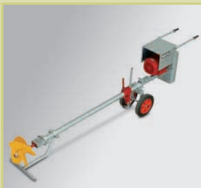
In serie con elica ad alta prestazione e piede di protezione