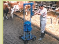
Miscelatore per pavimento grigliato di bovini