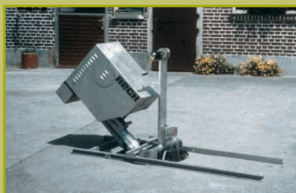
Miscelatore elettrico BLIZZARD con fissaggio di serbatoi per vasche coperte (regolabile in altezza continuo).