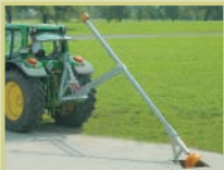
Miscelatore di liquame per vasche di liquame coperte

RECK – l'esperto di miscelatori di liquame, sistemi "slalom", miscelatori per pavimento grigliato e distributori di silaggio. Siamo lieti di spedire i nostri depliant a sue conoscenze di tutti i prodotti RECK.