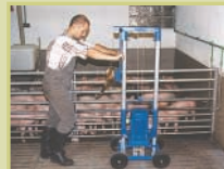
Miscelatore per pavimento grigliato di maiali