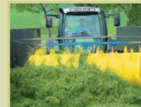
Distributore di silaggio per silo a trincea praticabile