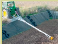
Miscelatore di liquame per vasche di liquame aperte