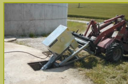
Attacco al caricatori frontale con tecnica di cambio rapido. Per vasche aperte e coperte fino un'altezza di ca. 3m.