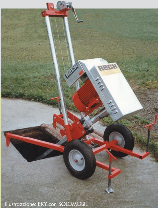
Illustrazione: EKY con SOLOMOBIL

Un miscelatore maneggevole con enorme prestazione. Adatto a sciogliere incrostazioni solide.