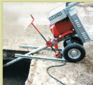
Inclinazione con la manovella