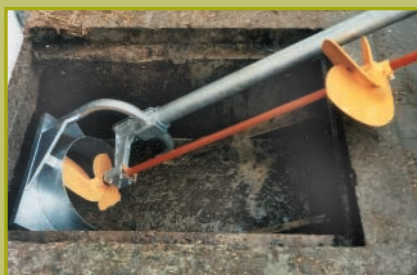
Da 1,80m di profondità del canale, e consigliabile di prendere un miscelatore a doppio telaio e elica per croste flottante. Stoccaggio sotto la stalla (da 1,80m) risparmia vasche esterni.