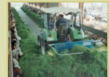
Distributore di foraggio verde